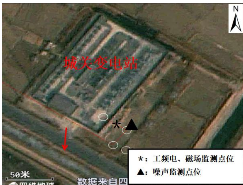
专题图 2 类比地下电缆电磁监测断面示意图