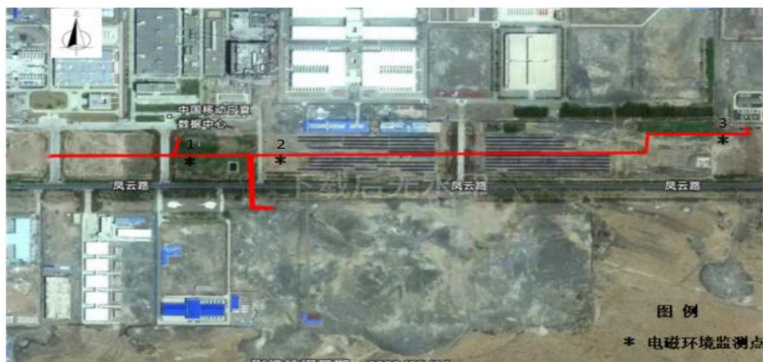
专题图 1 在建线路监测点位示意图