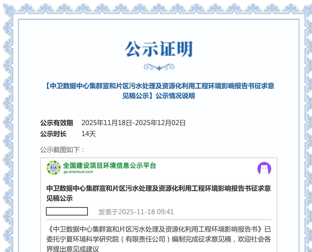
图 2 征求意见稿网络公示截图