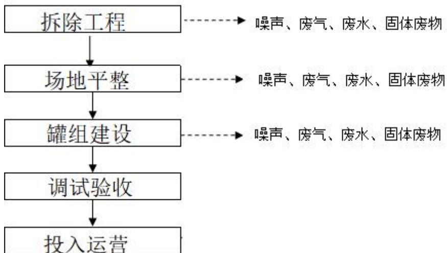
图2 施工期工艺流程及产污环节

本项目施工期主要建设内容为原品控楼进行拆除后进行储罐组建设，具体工艺流程及产污环节详见下图：