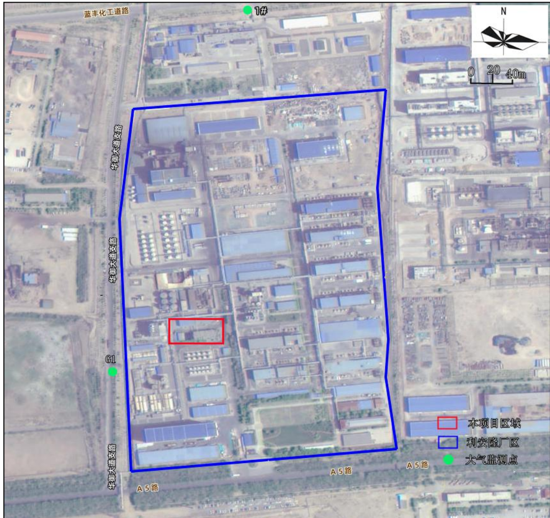
图 3-1 大气监测点位图

由上表监测结果可知, TSP 的 24 小时平均浓度满足《环境空气质量标准》及修改单(GB3095-2026)过渡阶段二级标准浓度限值要求。